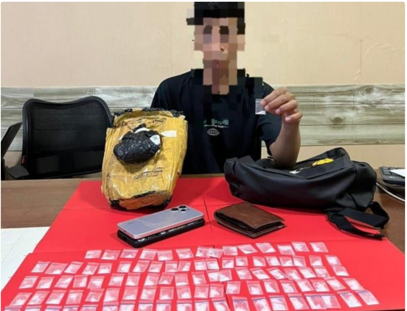
seorang pria berinisial RF (22 tahun) bersama Babuk Sabu